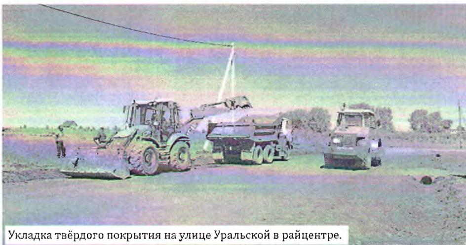
Укладка твёрдого покрытия на улице Уральской в райцентре.