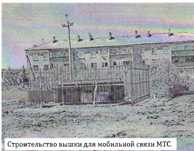
Строительство вышки для мобильной связи МТС.