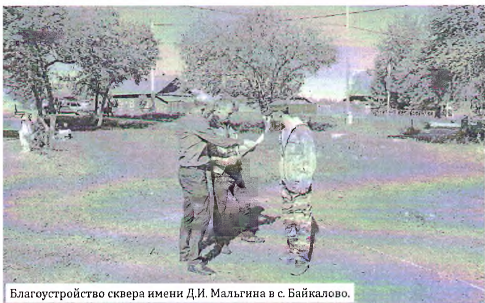
Благоустройство сквера имени Д.И. Мальгина в с. Байкалово.