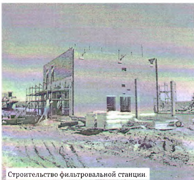
Строительство фильтровальной станции.